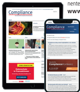
Online-Zeitschrift und Newsletter

„Compliance“ ist die zentrale Informations- und Kommunikationsplattform für Compliance-Verantwortliche im deutschsprachigen Raum. Die Online-Zeitschrift wird an rund 8.500 Abonnenten per E-Mail-Newsletter versendet und kann auch direkt über